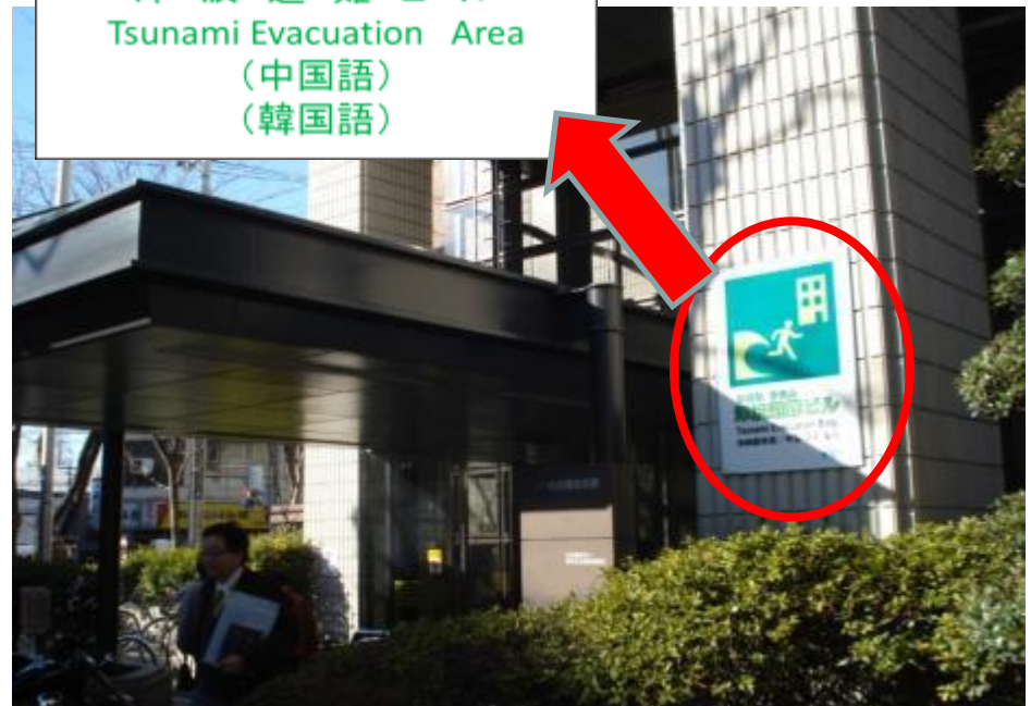
堺市総合福祉会館